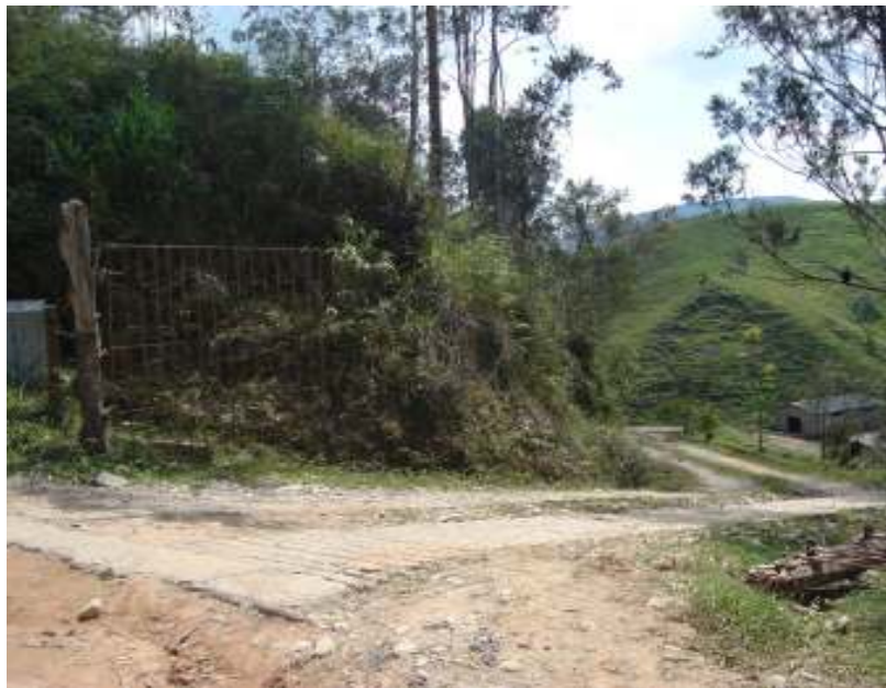
Foto 9 Vía de acceso al Relleno Sanitario

La vía de acceso al Relleno se encuentra en buenas condiciones, pero es recomendable estar inspeccionándola y en caso de requerirse pedir al Municipio el mantenimiento de la misma para evitar accidentes o regueros de basura. Es de notar, que en época de invierno la vía puede presentar mayor deterioro, por tanto deben tomarse medidas en este tiempo como por ejemplo estar alerta con el sistema de drenaje establecido, para evitar empozamiento de agua en la vía y las áreas aledañas. Igualmente, valdría la pena realizar un lleno y compactar la vía ya que presenta algunos tramos muy asentados (centro de la vía), producto del peso del vehículo recolector sumado al peso de los residuos.