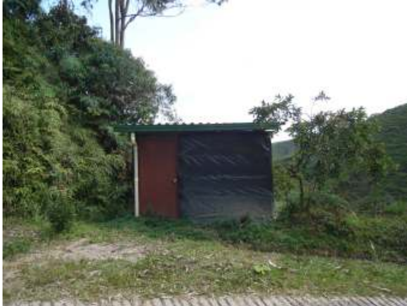
Foto 10 Caseta de Almacenamiento de Residuos Hospitalarios