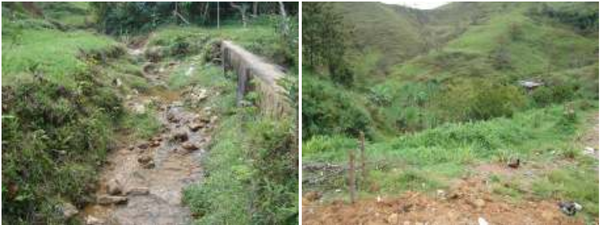
Foto 1 Área de Influencia Directa

El área de influencia directa fue definida como los predios en los cuales se encuentra asentado el sitio de disposición y una franja o zona dominada por pastos no mejorados, ganadería extensiva y en menor proporción por algunos cultivos de café, caña panelera y plataneras. Asimismo se encuentra dentro de esta área de influencia un cuerpo de agua superficial ubicado en la zona baja del Relleno, el cual es el receptor del vertido de Lixiviado proveniente del tratamiento del mismo. Los asentamientos humanos en esta área son escasos, al igual que la presencia de especies nativas de la región. La fauna silvestre es escasa.