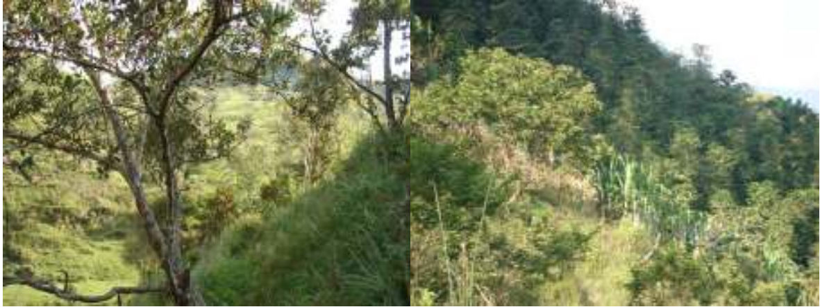
Foto 12 Zona aledaña al Relleno Sanitario