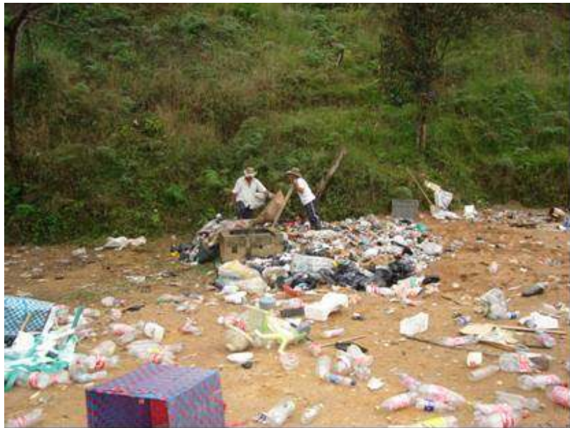
Foto 8 Residuos dispuestos en el Relleno Sanitario

La zona de descargue de los residuos se realiza dentro del sitio, una vez descargados estos, los operarios proceden a separar el material reciclable que llega al Relleno con los residuos comunes, dentro de los cuales se encuentran principalmente plástico, cartón, vidrio y chatarra (Ver Foto 8) .