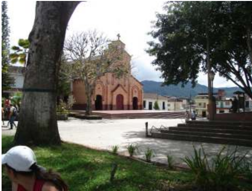
Foto 2 Zona Urbana Municipio de Alejandría

El proceso histórico del Municipio de Alejandría muestra el surgimiento de este sitio como eminentemente minero y paso obligado de los caminos entre el oriente, en especial del Municipio de Concepción y posteriormente establecido como sitio de congregación de los mineros allí localizados.