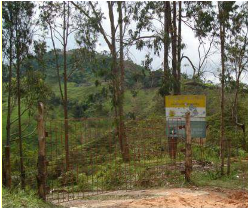
Foto 3 Entrada del Relleno Sanitario

Esta valla se encuentra un poco deteriorada, evidenciándose la necesidad de retocarla nuevamente (Ver Foto 3).