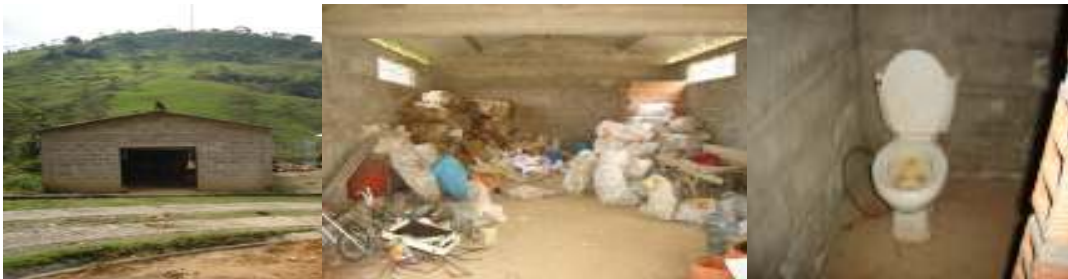
Foto 4 Bodega para el almacenamiento de Material Reciclable y Herramientas de Trabajo

aproximadamente. Esta caseta está construida en adobe de cemento, tiene techo de eternit y en los costados cuenta con rejillas (ancho 2.0m y alto 0.43m) que facilitan la ventilación del material depositado en el sitio, evitando la generación de olores desagradables, asociados a algunos materiales reciclados. En el fondo de la caseta se ubica un baño que presenta condiciones sanitarias muy regulares, el cual no es usado por los operarios del Relleno (Ver Foto 4), no solo por las condiciones en la que se encuentra, sino también por la falta de agua en el sitio, ya que hace algunos meses no se cuenta con este recurso debido a que una parte del sistema de conducción fue robado. Por lo tanto en el momento se están buscando alternativas que permitan que esto no suceda nuevamente, y se pueda tener disponibilidad de este recurso en el Relleno lo más pronto posible.