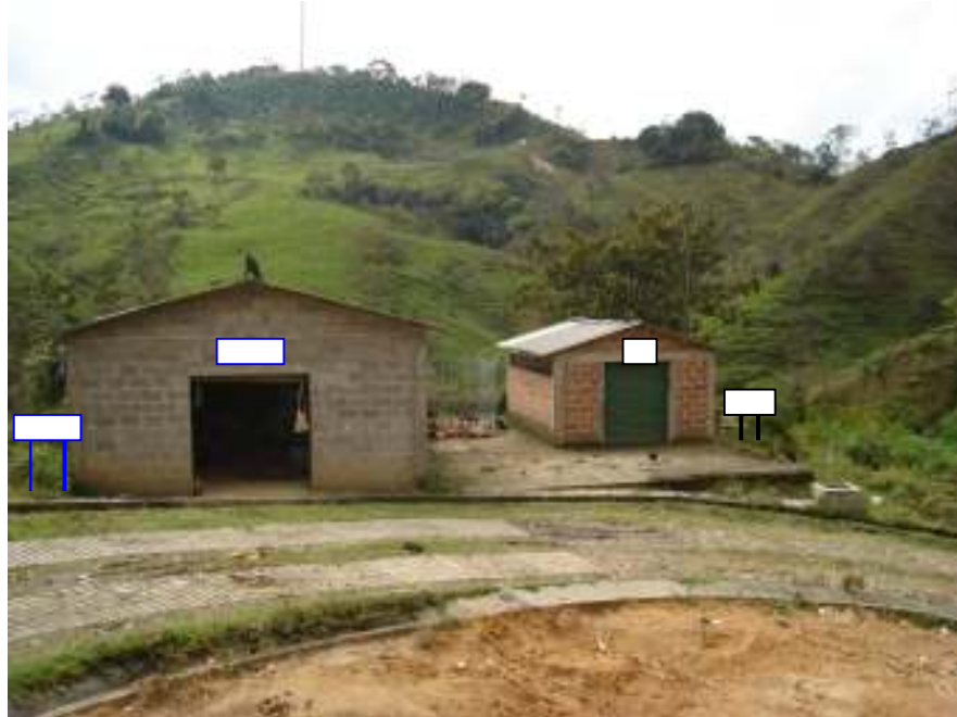
Foto 14 Costado izquierdo bodega de almacenamiento Herramientas y reciclaje, costado derecho bodega almacenamiento de huesos