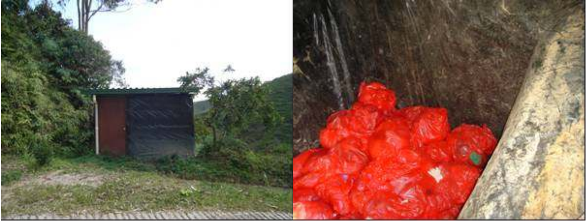
Foto 6 Caseta de Residuos Hospitalarios y forma de almacenamiento