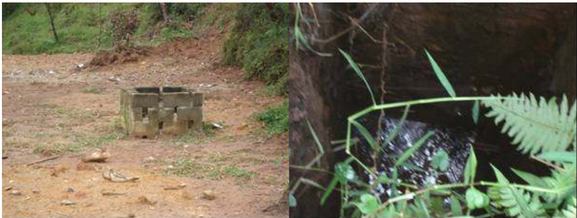
Foto 11 Tanque de aguas lluvias

Además se sugiere realizar limpieza a estos tanques con la misma frecuencia con la que se realiza a los canales, para evitar el crecimiento de hierbas dentro de ellos.