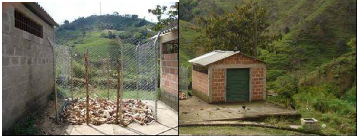
Foto 5 Malla para secado de Huesos y Bodega de Almacenamiento de Huesos