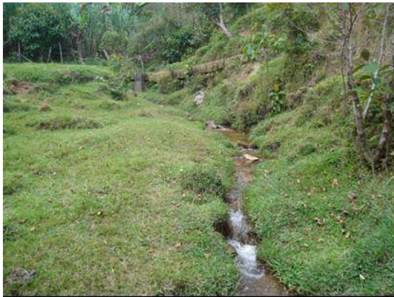
Foto 13 Quebrada receptora del Lixiviado producido en el Relleno Sanitario

Un aspecto adicional a considerar es que cuando se conoce la calidad del agua superficial que es receptora de algún tipo de contaminante se pueden implementar las medidas de control necesarias para mitigar el grado de contaminación del agua, los riesgos potenciales sobre las plantas y animales que habitan dentro y cerca del cuerpo de agua. Además, permite a la autoridad ambiental conocer las condiciones de calidad y disponibilidad del cuerpo de agua para los diferentes usos y evaluar la calidad de los vertimientos, frente a lo establecido en la normatividad vigente.